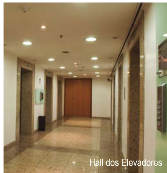
Hall dos Elevadores