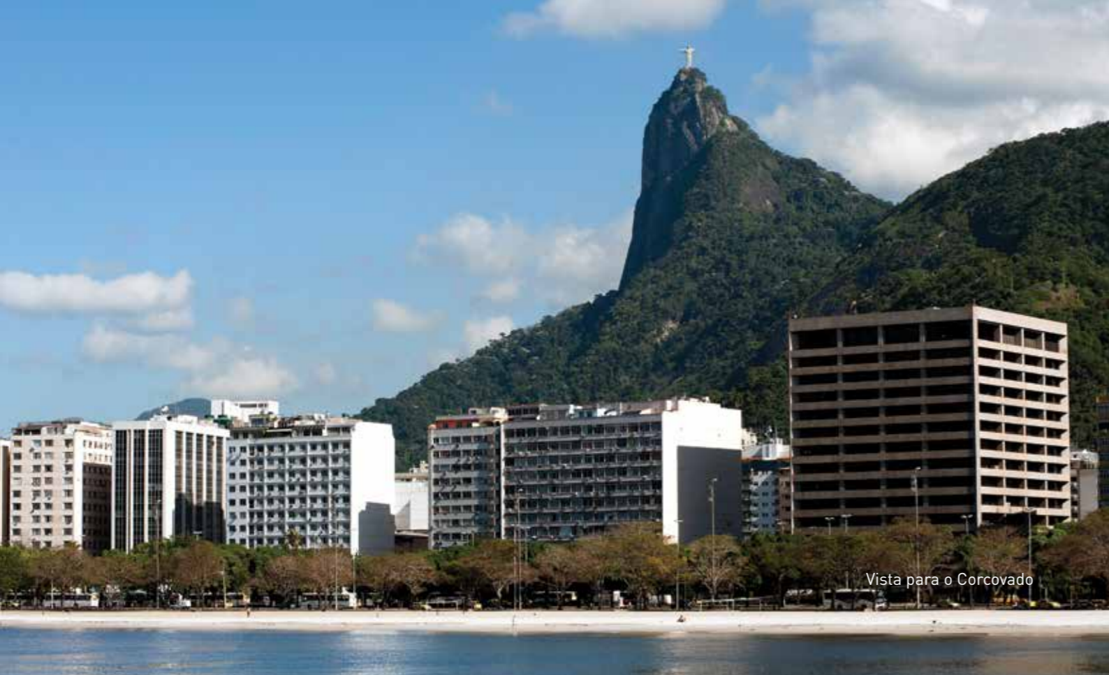
Vista para o Corcovado