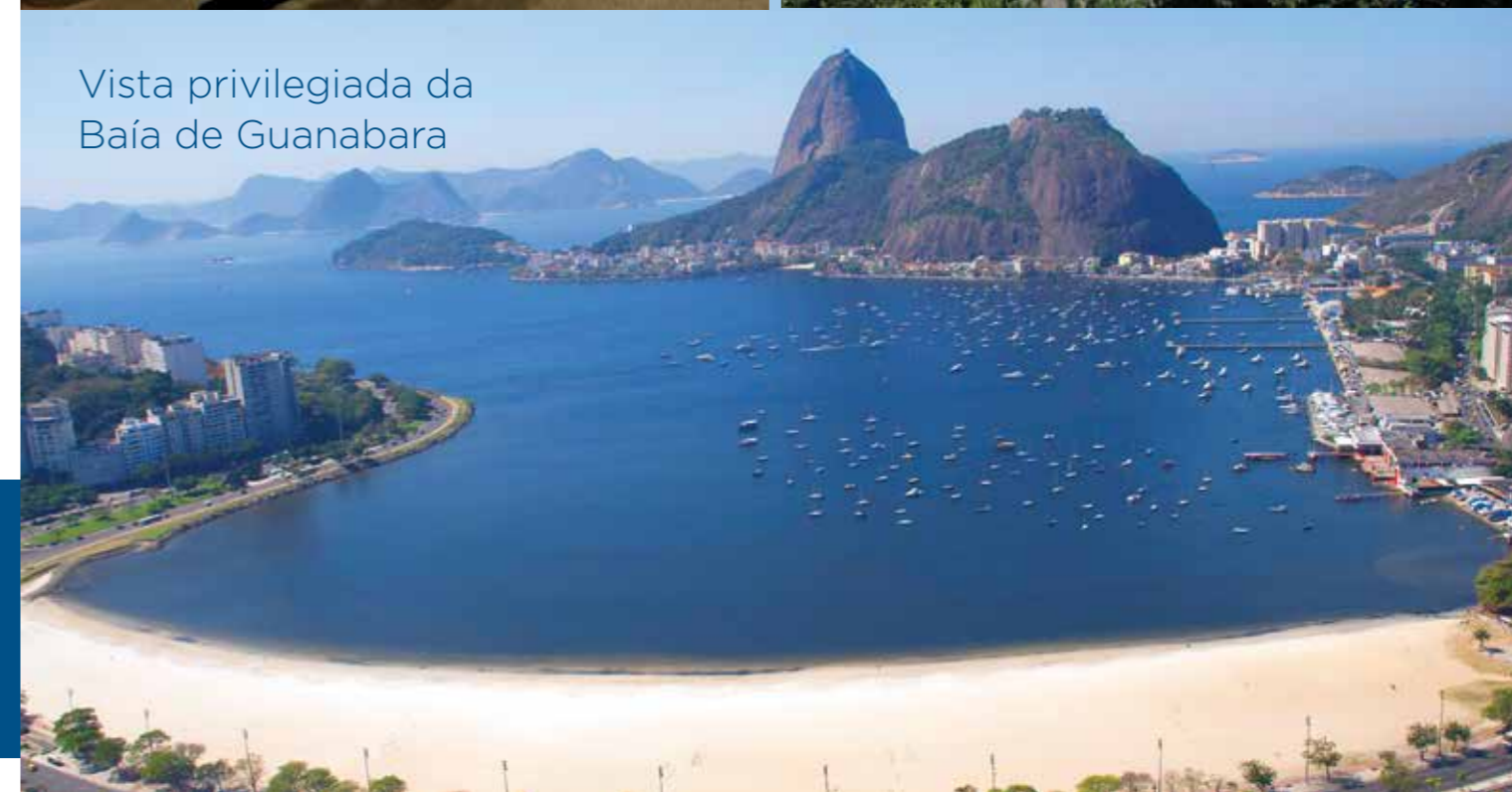
Vista privilegiada da Baía de Guanabara